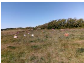
Buckfast bevruchtungsstation aan de Pietje Miedeweg.

Helaas constateerden wij (gelukkig wel op tijd) dat er enkele andere volken op het eiland stonden. In samenwerking met de gemeente hebben we deze volken van het eiland gehaald! Er is een gemeentelijke verordening op Ameland die ons het recht geeft om alleen bijenvolken te plaatsen. Zelfs andere buckfastbijen mogen er niet staan, zodat die speciale buckfastlijn van onze stichting voor dat jaar zorgt voor bevruchting. Ieder jaar is dat een andere lijn.