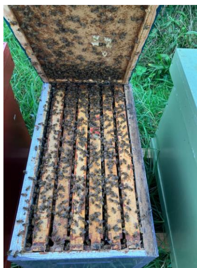
Jans in actie met zesramers.